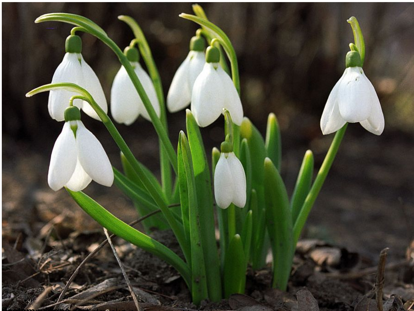
www.MuzeumKrajoznawczeLodz.pl Wszystkie lasy,